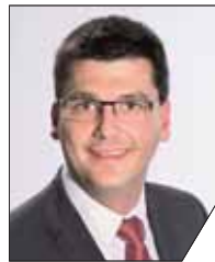
Jonas Merzbacher 1. Bürgermeister, Kreisrat Gundelsheim