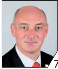
Markus Zirkel 1. Bürgermeister, Kreisrat Hallstadt