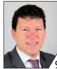
Carsten Joneitis 1. Bürgermeister, Kreisrat Oberhaid