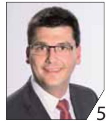
Jonas Merzbacher 1. Bürgermeister, Kreisrat Gundelsheim