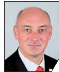
Markus Zirkel 1. Bürgermeister, Kreisrat Hallstadt