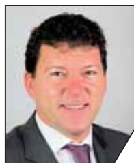
Carsten Joneitis 1. Bürgermeister, Kreisrat Oberhaid